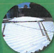
Cuisine Centrale de paris